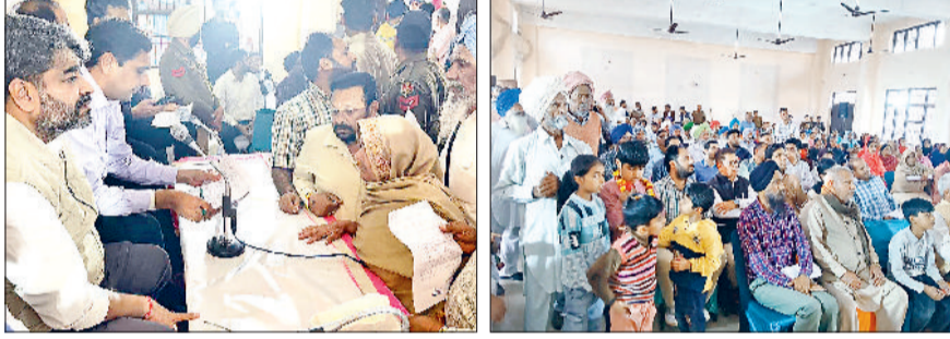
अंबाला। ग्रामीणों की समस्याएं सुनते पूर्व राज्यमंत्री व मौजूद लोग।

पूर्व राज्यमंत्री ने इस मौके पर यह भी कहा कि मुख्यमंत्री नायब सिंह सैनी व्यक्ति के धनी हैं। कोई भी व्यक्ति उनसे निःसंकोच मिल सकता है। रात को भी वह लोगों की समस्याएं सुनते हैं। मुख्यमंत्री के कुशल मार्गदर्शन में पूरे प्रदेश में विकास कार्य की ब्यार बह रही है। उन्होंने कहा कि रात्रि ठहराव कार्यक्रम के दौरान सरकार आपके द्वार पर आकर लोगों की समस्याएं सुन रही है वहीं उनका समाधान करने की दिशा में भी कार्य कर रही है।