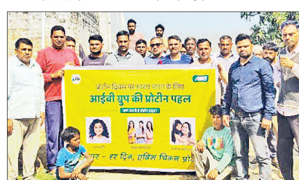
पानीपत। ग्रामीणों को जागरूक करते आईबी गुप के सदस्य।