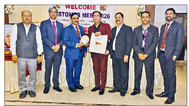
यह रहे उपस्थित

पंजाब नेशनल बैंक ने को प्रेम प्लाजा, करनाल में एमएसएमई ग्राहकों के लिए एक ग्राहक मिलन कार्यक्रम आयोजित किया, जिसमें 45 एमएसएमई ग्राहकों ने भाग लिया। कार्यक्रम के दौरान बैंक ने राइस शेरस एवं टिम्बर मर्चेन्ट्स के लिए अपनी क्लस्टर आधारित ऋण योजनाओं की जानकारी दी, जिनमें आकर्षक ब्याज दरों पर वित्त उपलब्ध कराया जा रहा है।