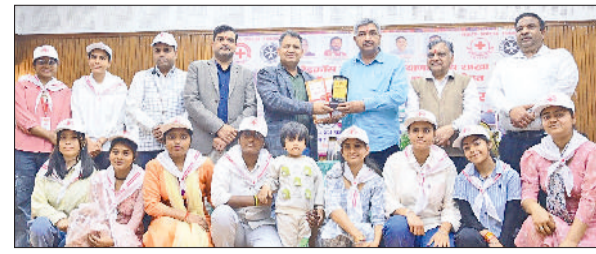
पानीपत। विजेताओं को पुरस्कार प्रदान करते अतिथि व आयोजक।