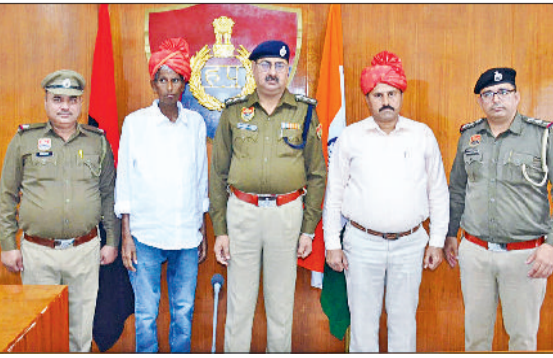
सेवानिवृत्त कर्मचारियों के परिजन भी इस भावुक एवं सम्मानपूर्ण क्षण के साक्षी बने। उप पुलिस अधीक्षक द्वारा दोनों अधिकारियों को स्मृति-