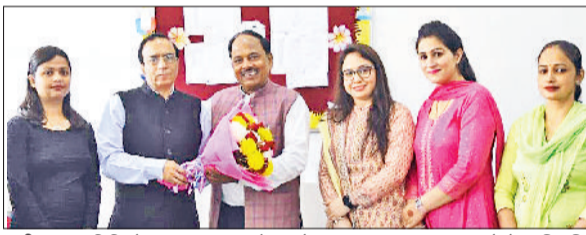
पानीपत। अतिथियों का स्वागत करते आयोजक।